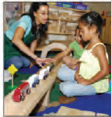
En prekindergarten, el maestro se toma el tiempo de evaluar los conocimientos y las competencias de los niños en un entorno auténtico. "Si quito un auto, ¿cuántos te quedan? ¿Cómo lo sabes?"